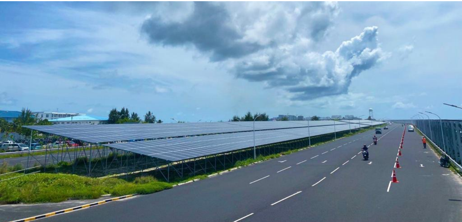
မြန်မာ့အလင်းဘဏ်အဖွဲ့အစည်း၏ အစီအစဉ်ချမှတ်ထားသည့် အစီအစဉ်များကို အကောင်အထည်ဖော်ဆောင်ရွက်ခဲ့ပါသည်။

အစီအစဉ်ချမှတ်ထားသည့် အစီအစဉ်များကို အကောင်အထည်ဖော်ဆောင်ရွက်ခဲ့ပြီး အစီအစဉ်ချမှတ်ထားသည့် အစီအစဉ်များကို အကောင်အထည်ဖော်ဆောင်ရွက်ခဲ့ပါသည်။