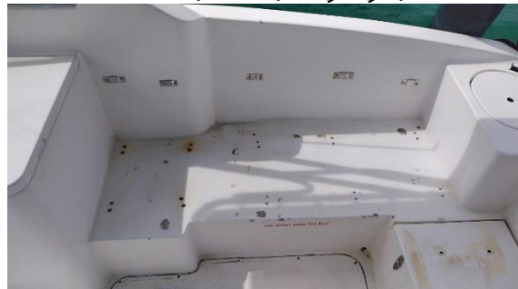
9. تصویر از داخل کابین کشتی، در سمت چپ کابین