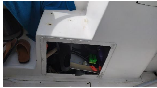
6. تصویر از داخل کابین کشتی