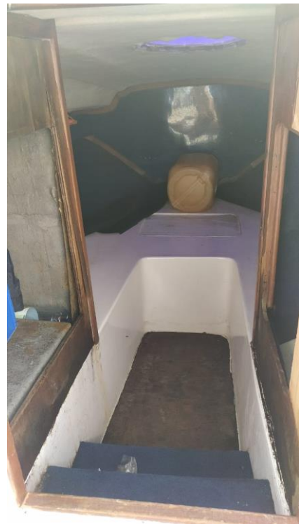
8. تصویر از داخل کابین کشتی، در سمت چپ کابین